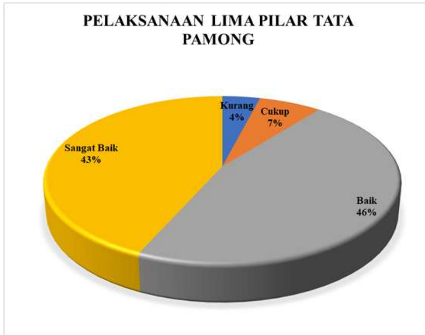
Diagram 3.1 Persentase Hasil Survei Kepuasan Dosen terhadap Proses Layanan Manajemen pada Pelaksanaan Lima Pilar Tata Pamong

Berdasarkan Diagram 3.1 di atas dapat dilihat bahwa Dosen yang memberikan nilai Sangat Baik 43% dan Baik sebanyak 46%. Nilai terbanyak terdapat pada poin 1.1: Kredibilitas. Dosen yang memberikan nilai Cukup hanya 7%, dan Dosen yang memberikan nilai kurang sebanyak 4% pada aspek ini. Sehingga pada aspek pelaksanaan lima pilar tata pamong berada pada kategori Baik .