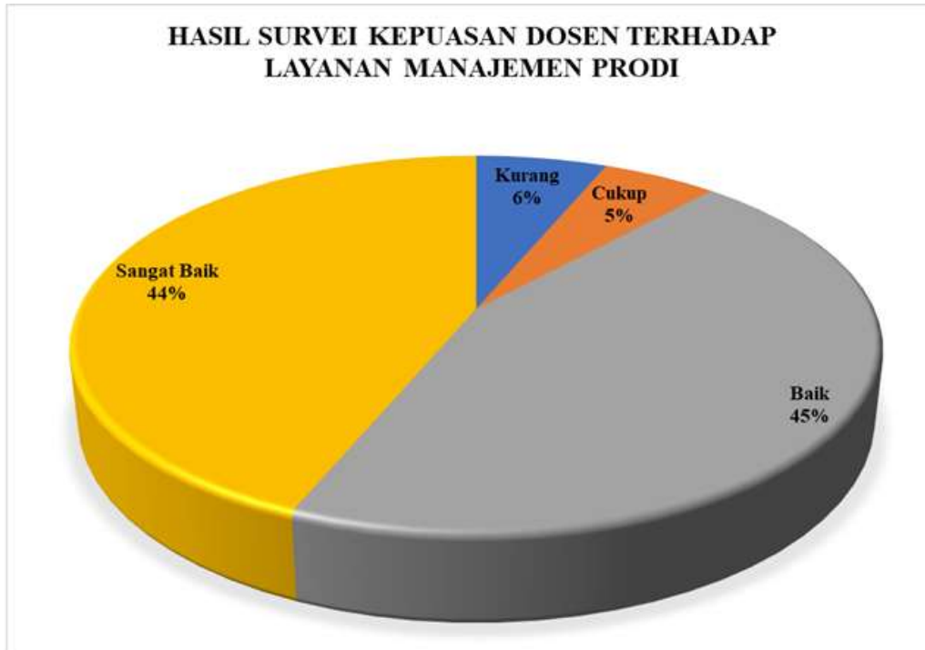
Diagram 4.1 Persentase Hasil Survei Kepuasan Dosen terhadap Proses Layanan Manajemen pada Program Studi Manajemen

Berdasarkan hasil survei dapat dilihat pada Diagram 4.1 yang menggambarkan bahwa secara keseluruhan dosen program studi Manajemen memberikan nilai Sangat Baik sejumlah 44%, nilai Baik sejumlah 45%, nilai Cukup sejumlah 5%, nilai kurang 6%. Jika merujuk pada Tabel 2.3 nilai persentase tersebut berada pada rentang 41-60%, sehingga dapat disimpulkan bahwa kepuasan Dosen terhadap proses layanan manajemen di program studi Manajemen masuk pada kategori CUKUP BAIK .