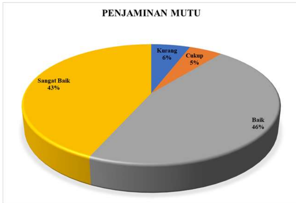
Diagram 3.4 Persentase Hasil Survei Kepuasan Dosen terhadap Proses Layanan Manajemen pada Penjaminan Mutu

Berdasarkan Diagram 3.4 di atas dapat dilihat bahwa dosen memberikan nilai Sangat Baik sejumlah 43% dan Baik sejumlah 46% pada aspek Penjaminan Mutu. Nilai terbanyak terdapat pada poin 4.2: Keberadaan dokumen mutu di Prodi. Sedangkan dosen memberikan nilai cukup sejumlah 5% dan memberikan nilai kurang sebesar 6% pada aspek ini. Sehingga pada aspek Penjaminan Mutu berada pada kategori Sangat Baik .